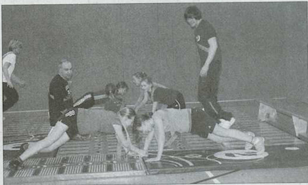
Auch die Muskeln wurden kräftig strapaziert.